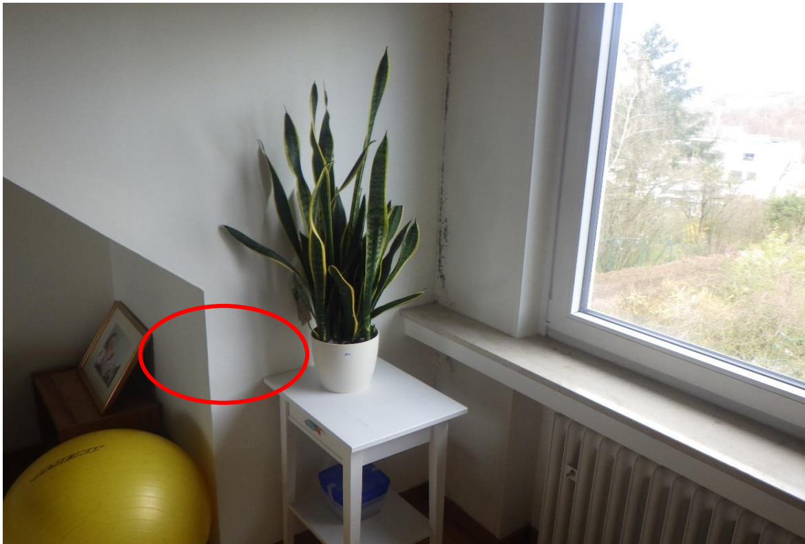
Zone des désordres à l'étage inférieur

Aucun point d'eau ne se trouve à l'aplomb des désordres, il s'agit d'une chambre mansardée.